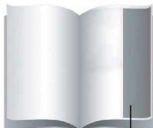
1/3 DE PÁGINA

Tiragem: 10 Mil Periodicidade: Bimestral